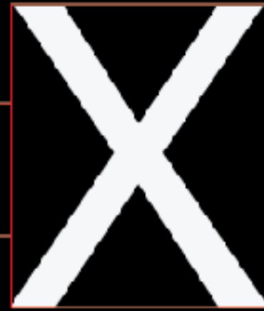
Neue Helvetica Regular